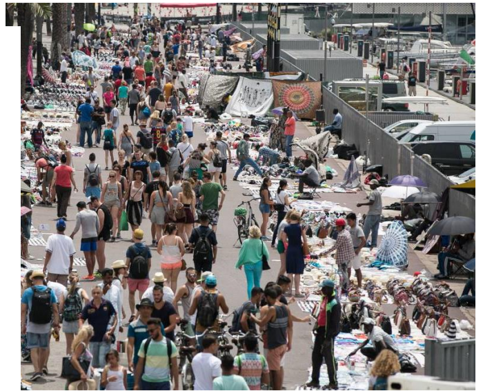
Mercats Top manta

La arribada dels grans centres comercials, que buiden de gent els carrers, dels outlets gegantins, els manters i la problemàtica social que comporten, el desembarcament del comerç xinès a l'engròs, la aparició de noves formes de comerç , e-comerç, i els canvis socials i d'horaris, fins i tot estem assistint a la desaparició de les rebaixes com a fet remarcable i puntual. Tots han tingut una forta incidència directa en el mon del comerç.