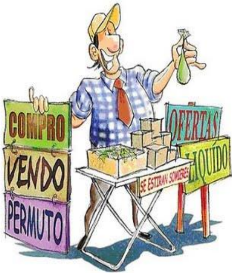
Mercats de segona ma

En els darrers anys hem vist i patit canvis no previstos ens han avançat ràpidament, creant noves situacions que ni podíem imaginar pocs anys abans. En lloc es més palpable i cridaner aquesta evolució i revolució que en el mon del comerç.